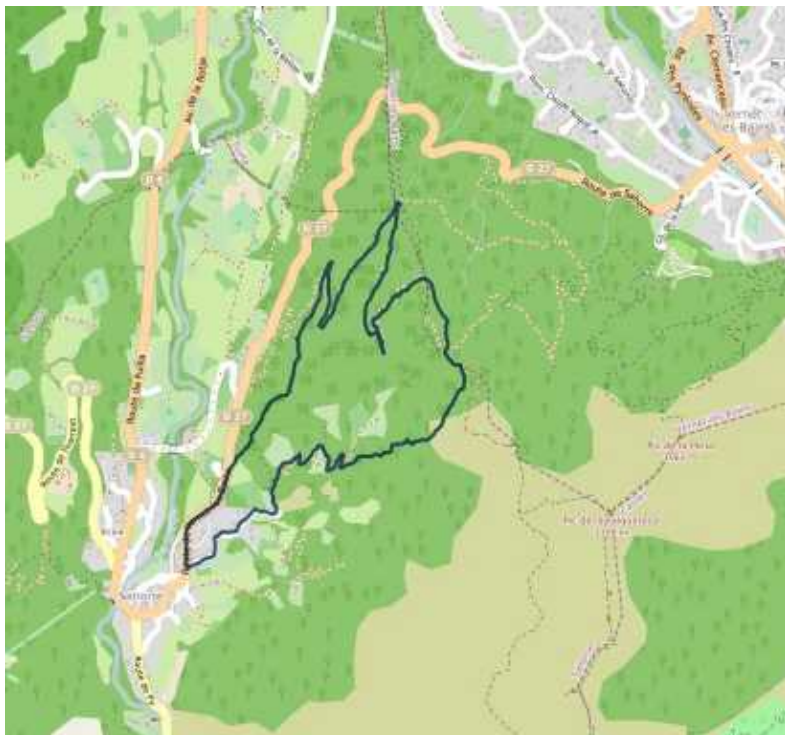
Carte IGN 2349 ET

Départ : Route de Vernet-les-Bains (conteneurs de tri sélectif) - Altitude 668 m -