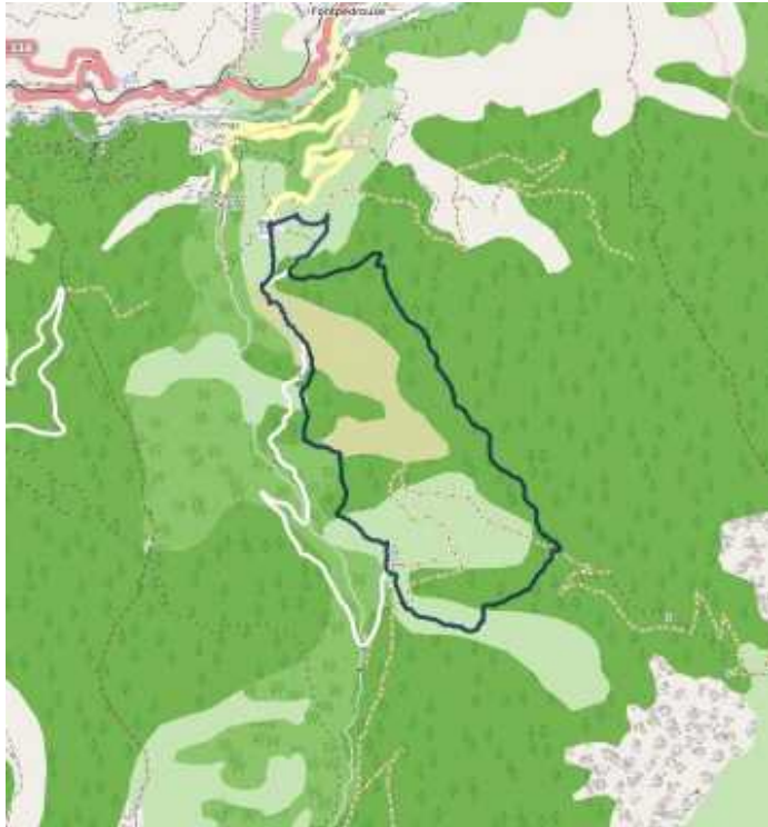
Carte Ign 1/25 ème 2249 ET et 2250 ET